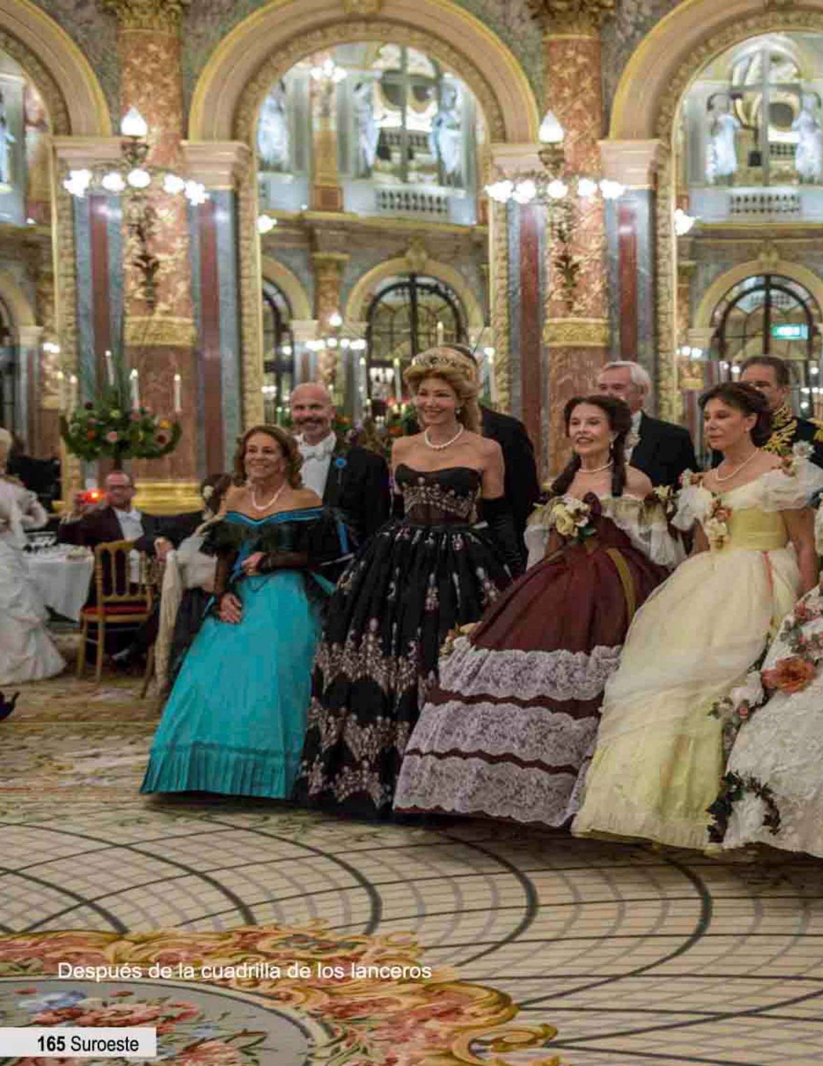
Después de la cuadrilla de los lanceros