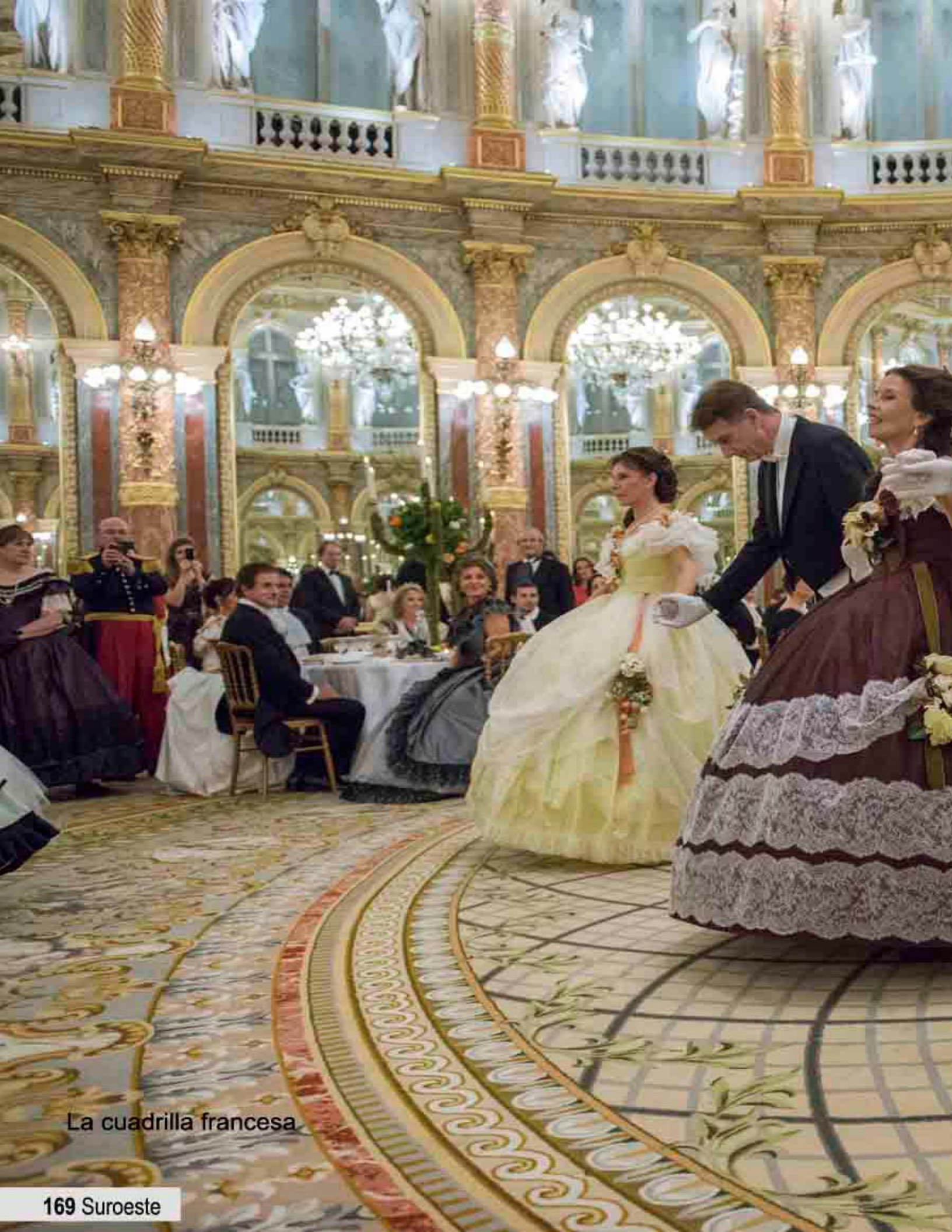
La cuadrilla francesa