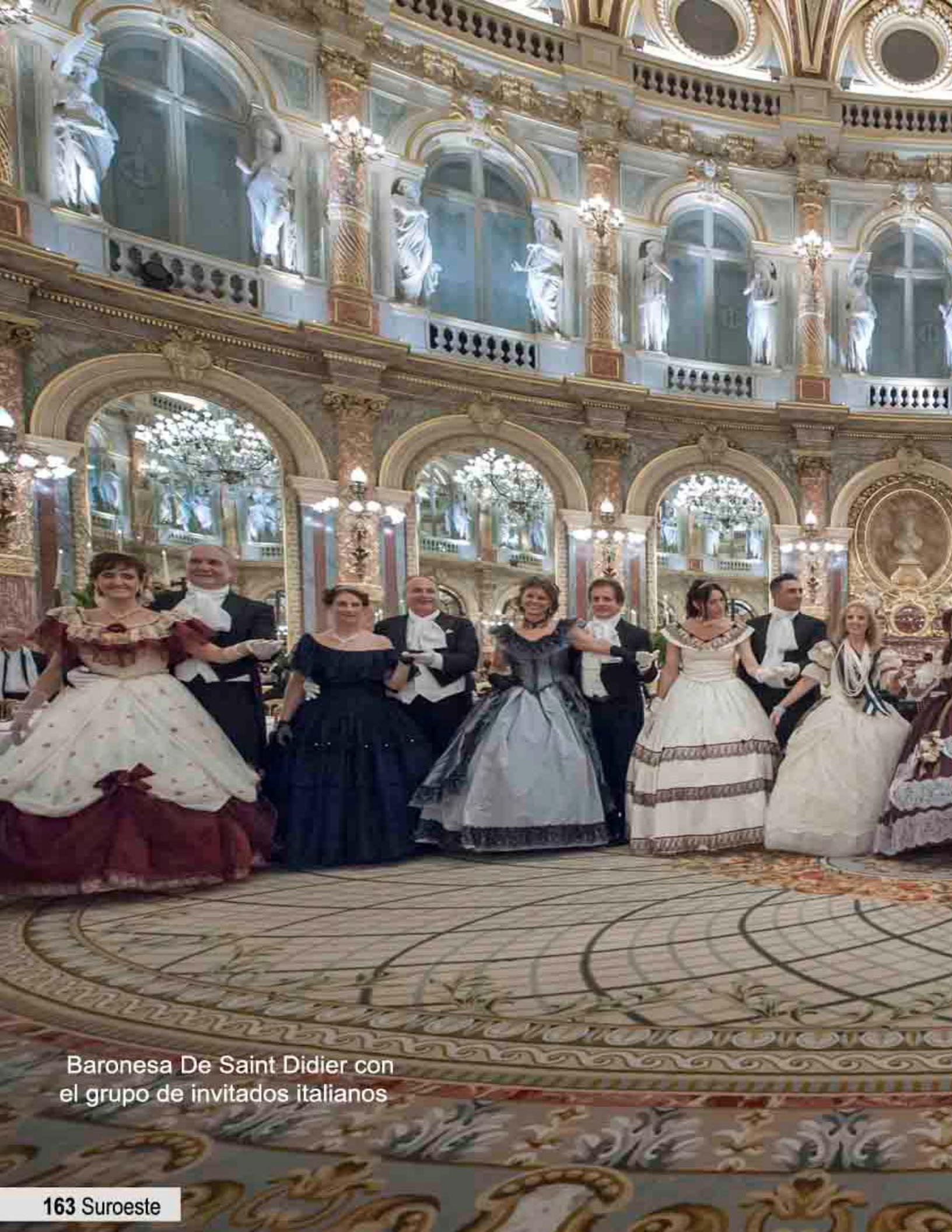
Baronesa De Saint Didier con el grupo de invitados italianos